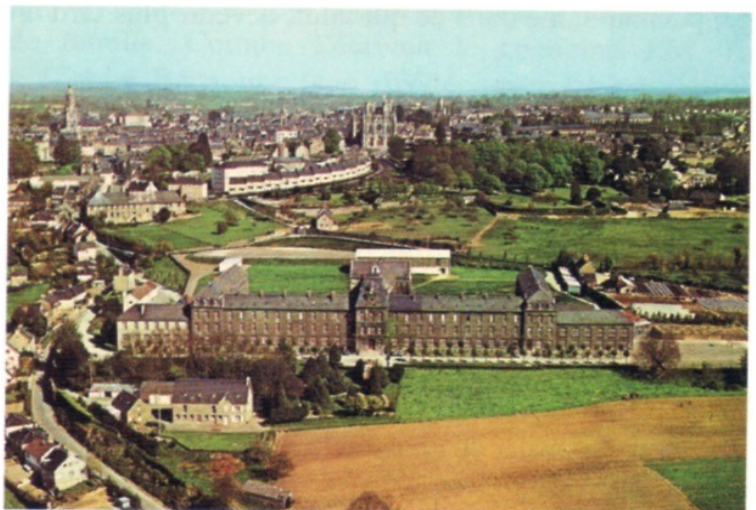
Avranches. Institut Notre-Dame