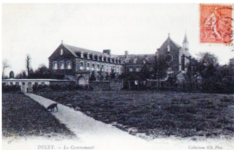
Ducey. Etablissement Sainte-Marie

par René Langlois. En 1909, M. Duchesne, chef d'institution à Paris y installa une colonie scolaire. En 1914, lors de la guerre, les locaux furent réquisitionnés et devinrent l'hôpital complémentaire n°33 pour les Français, puis n° 23 pour les Allemands. De 1916 à 1918, c'est un hôpital belge où l'on note beaucoup de décès. En 1923, l'Abbaye Blanche est remise en vente. Le 5 juillet une société va se constituer ( le Bocage Mortainais ) pour